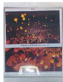
山東地域交流拠点【まんなか】