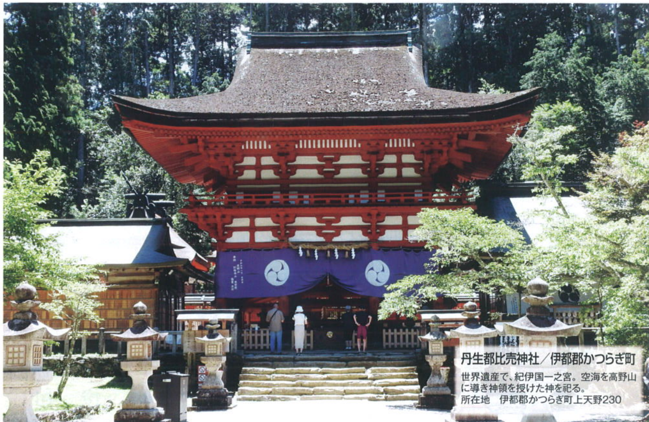
丹生都比売神社／伊都郡かつらぎ町 世界遺産で、紀伊国一之宮。空海を高野山に導き神領を授けた神を祀る。 所在地 伊都郡かつらぎ町上天野230

URL https://w-kankoji.com/ E-mail: wakayama@w-kankoji.com