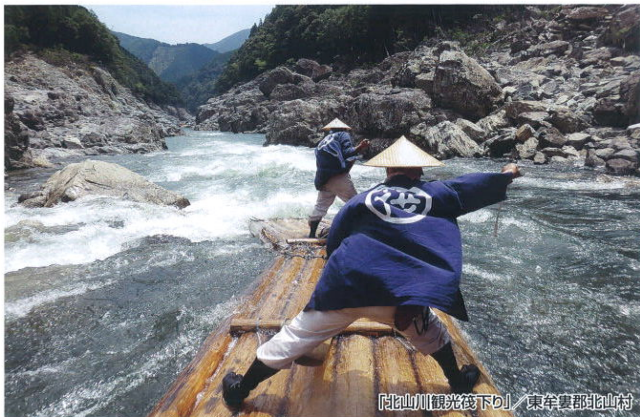
「北山川観光筏下り」／東牟婁郡北山村

URL https://w-kankoji.com/ E-mail:wakayama@w-kankoji.com