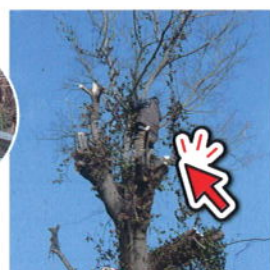
山賊発見!意外と身軽!!