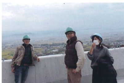
従業員さんと京奈和自動車道にて