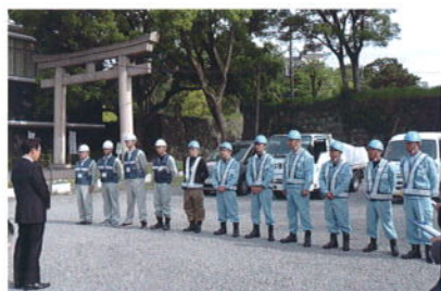
熊本地震災害復旧応援・出発式 山賊(黒シャツ)と海賊(右6名)たち

と共に海を渡って熊本地震災害復旧に派遣されたらいい、船酔いはしなかったのだろうか?常に酔っているのていまさらか?『北』の脅威を感じる!聞き取り調査に応じてくれるのか、やはりカラオケリモコンを使用しなければならないのか?危険地帯山口村に潜入し、『山賊たち』の生き様を徹底調査せよ!