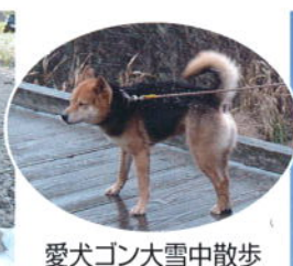
愛犬ゴン大雪中散歩 寒いよお~ (猟犬あらいくま担当)