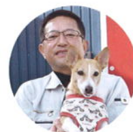
中山社長と四男(愛犬・ジャック)

Pon監事 ：そらそうと、10年ぶりの取材になるけど、兄弟やら子供さんやら、甥っ子姪っ子やら家系図はどうなってます？(社長は6男2女兄弟の次男 妻・長男31歳・次男27歳・三男25歳)