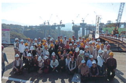
京奈和自動車道・雄ノ山ジャンクション 工事見学会(山口村探検隊)