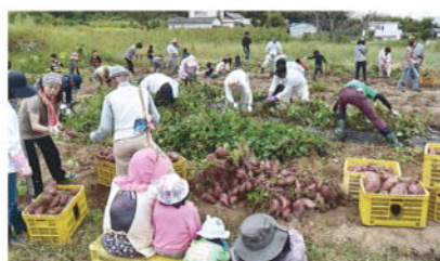
サツマイモ掘り ※手前家族はカカシです。