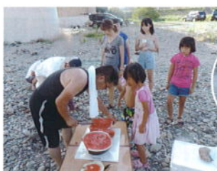
BBQのスイカ担当 (山賊が育てたスイカ)