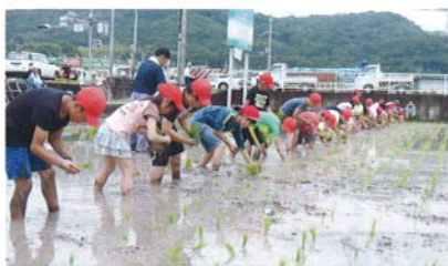
学童農園風景(山口小学校5年生)