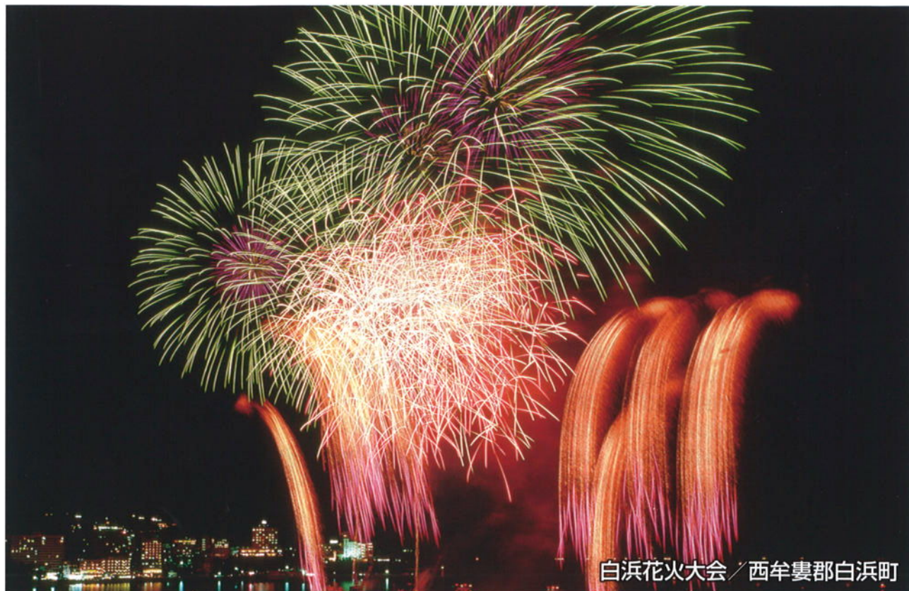
白浜花火大会 / 西牟婁郡白浜町

URL http://w-kankoji.com/ E-mail: wakayama@w-kankoji.com