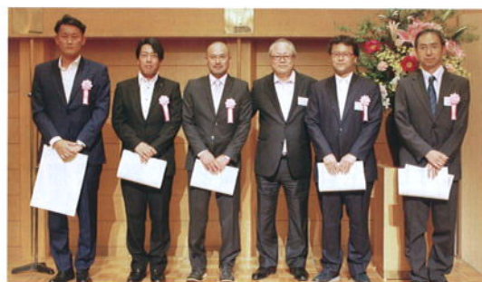
永年勤続被表彰者