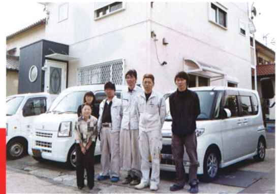
社長(右から2番目)と従業員

新シリーズ『Pon愛之助の解明!現地捜査』第三弾 『 真実を暴け、紀の水最強の 海軍を徹底調査せよ! 』