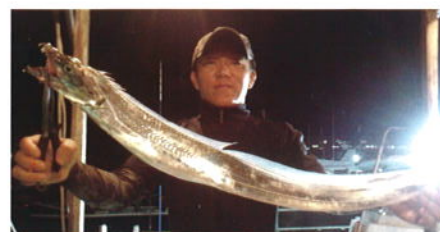
太刀魚獲ったどー!!