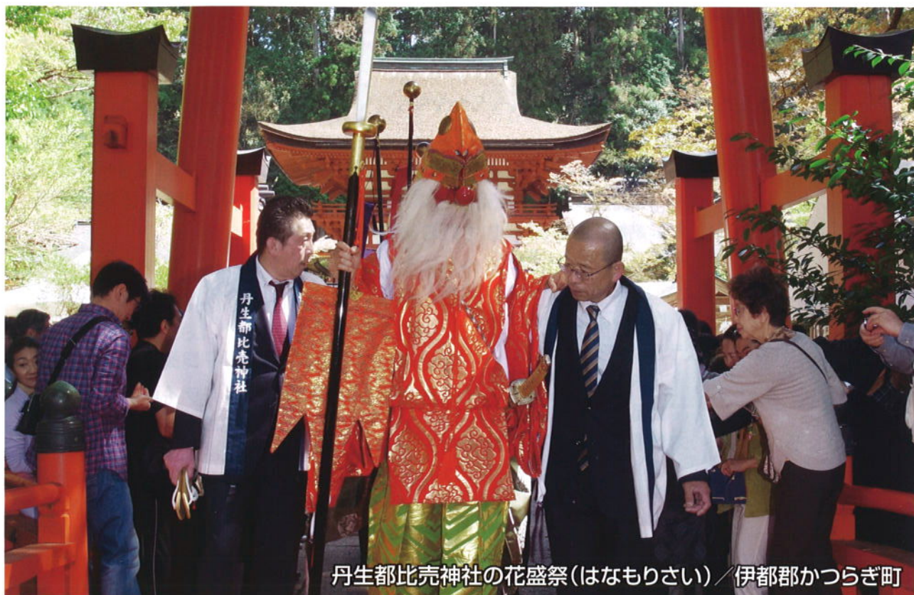
丹生都比売神社の花盛祭(はなもりさい) / 伊都郡かつらぎ町

URL http://w-kankoji.com/ E-mail: wakayama@w-kankoji.com