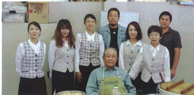
「濱本局長&お鍋ちゃんズ」