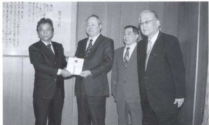
那智勝浦町へ災害寄付金を贈呈 (寺本町長)