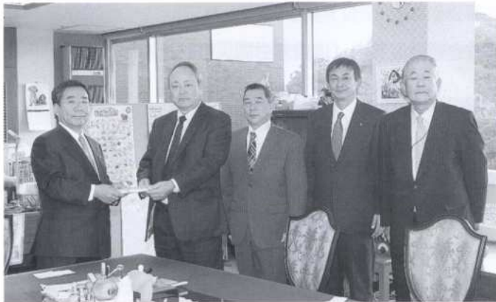
和歌山市を通じて災害義援金を贈呈 (大橋市長)