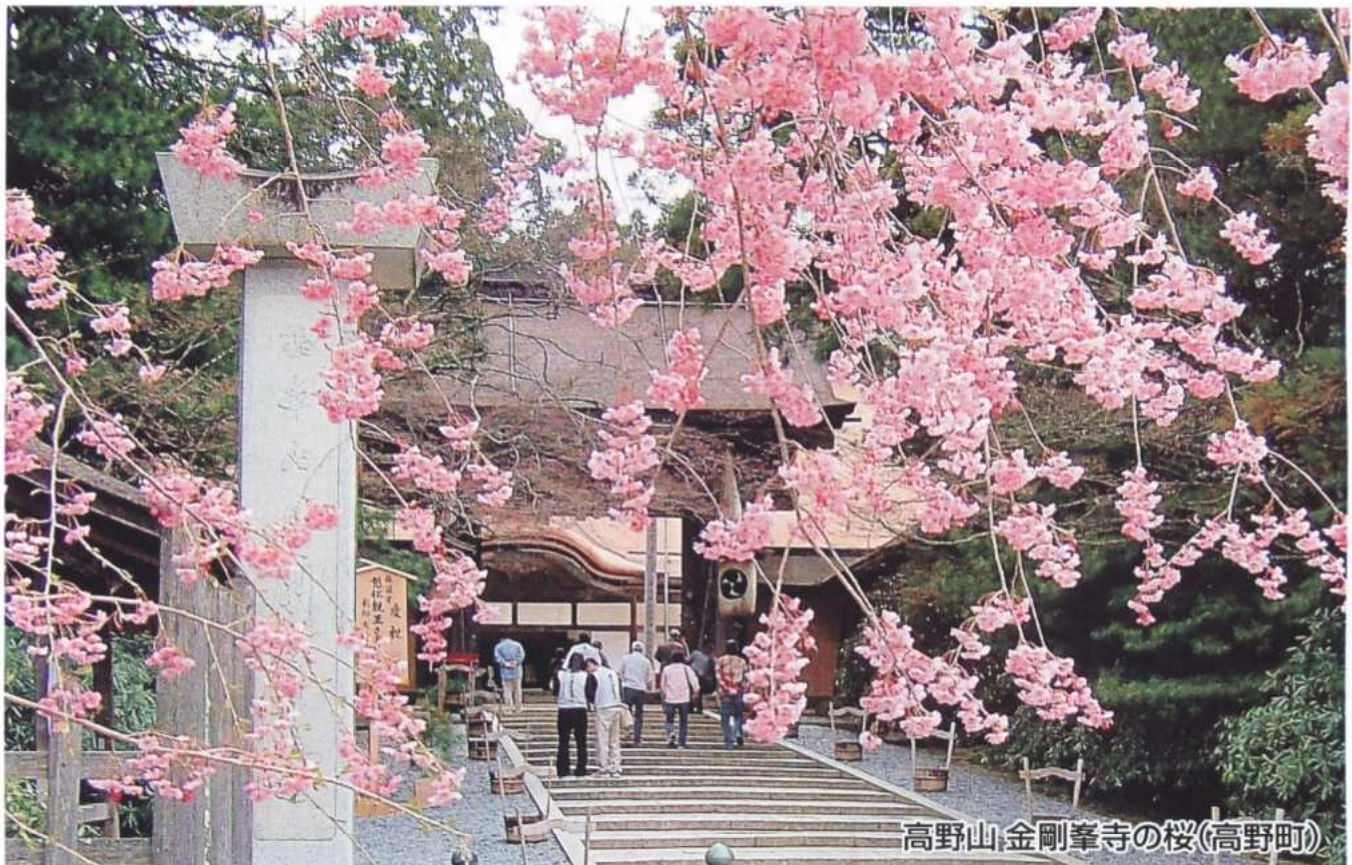
高野山 金剛峯寺の桜(高野町)