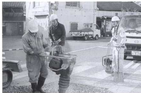
海南市黒江にて工事中

おじゃマンⅡ号：アスファルト合材も到着、復旧工事 が再開し始めたので、おじゃマンは退散いたします。