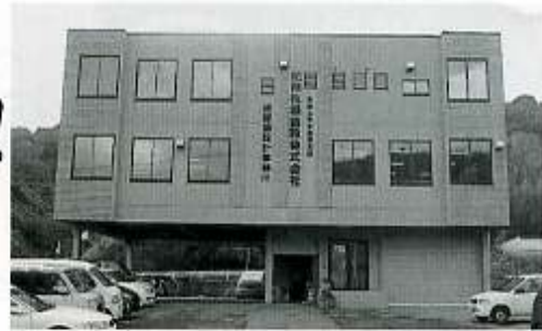
紀州住機建設株式会社 和歌山市岩橋1632-1