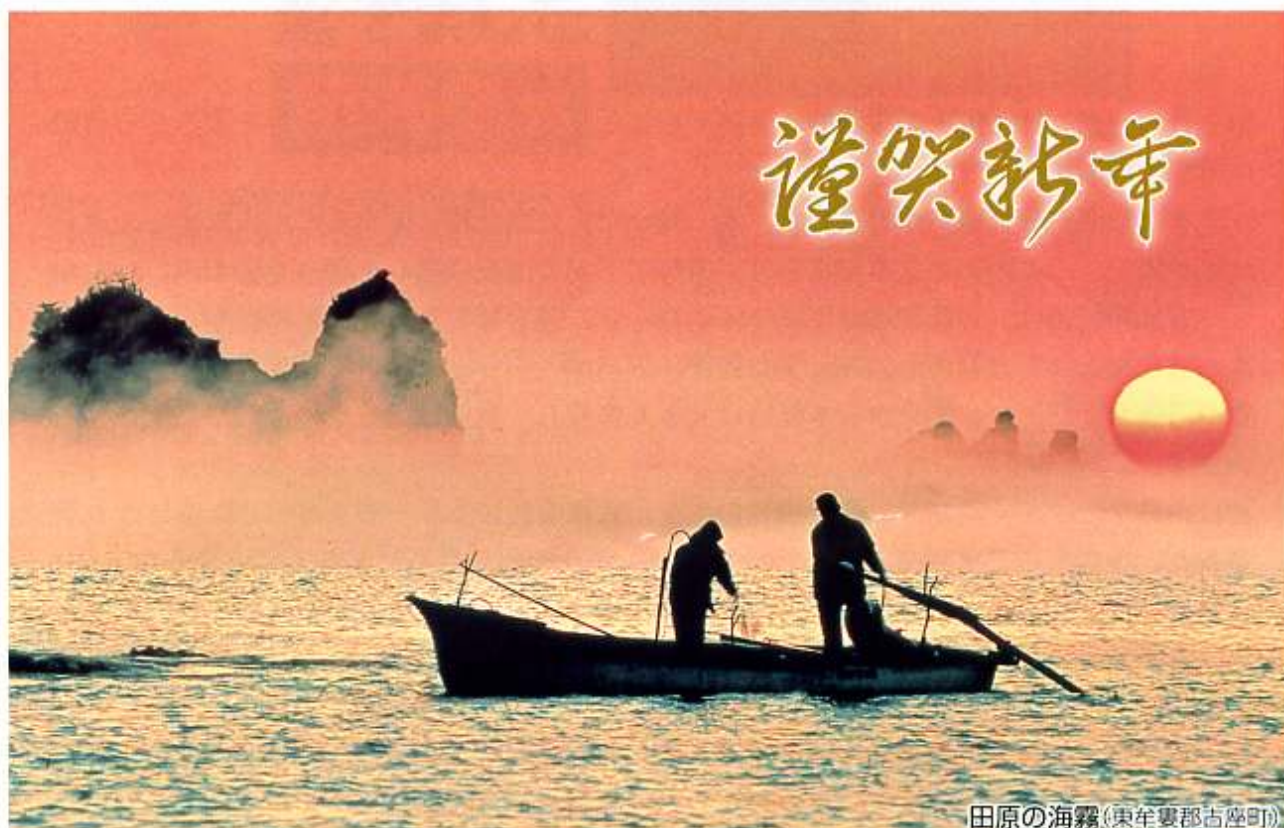
田原の海霧(東牟婁郡古座町)