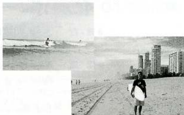
オーストラリアにて

エッ!今年は寅年・・・18H やっちゃいました。タイガー・Uzちゃん（48歳）の「リカバリー・SH 011」でした。今年もよろしく。