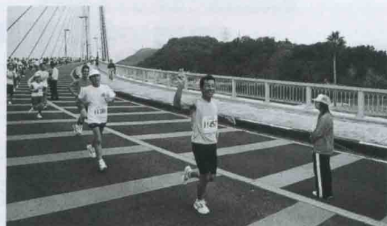
和歌浦ヘイマラソンにて

Uchiyan ：さすが水道屋さん『〇〇にしかれよ』ですね一、私もがんばります。