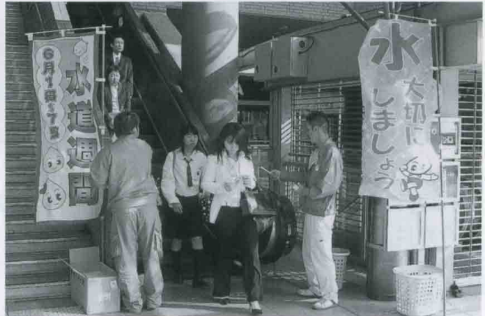
南海和歌山市駅前にて

これからも、市民の皆さんに水道に対する理解と関心をより一層高めることを目的として、この活動を続けて行きたいと思えます。