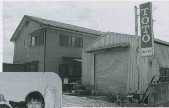
南出水道店 和歌山市川辺451-3