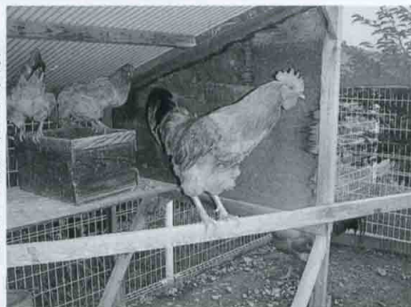
元気な名古屋コーチン……でも?