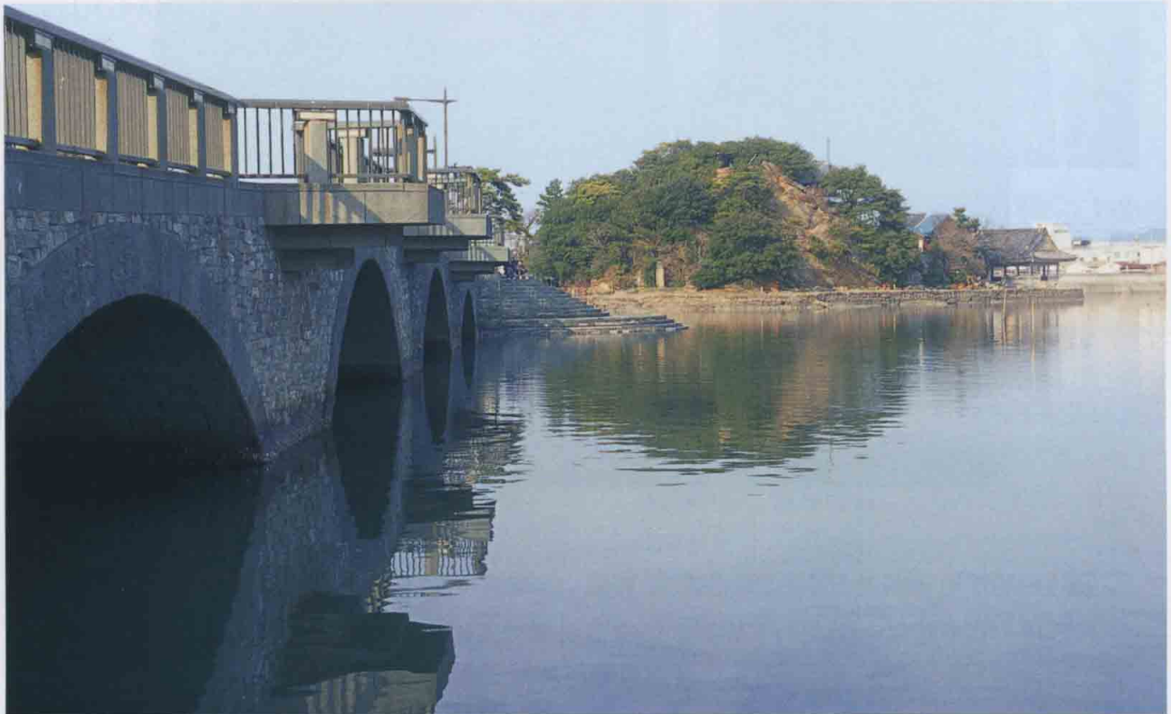
「あしべ橋」と「観海閣」(和歌山市和歌浦)

URL http://www.w-kankoji.com E-mail: wakayama@w-kankoji.com